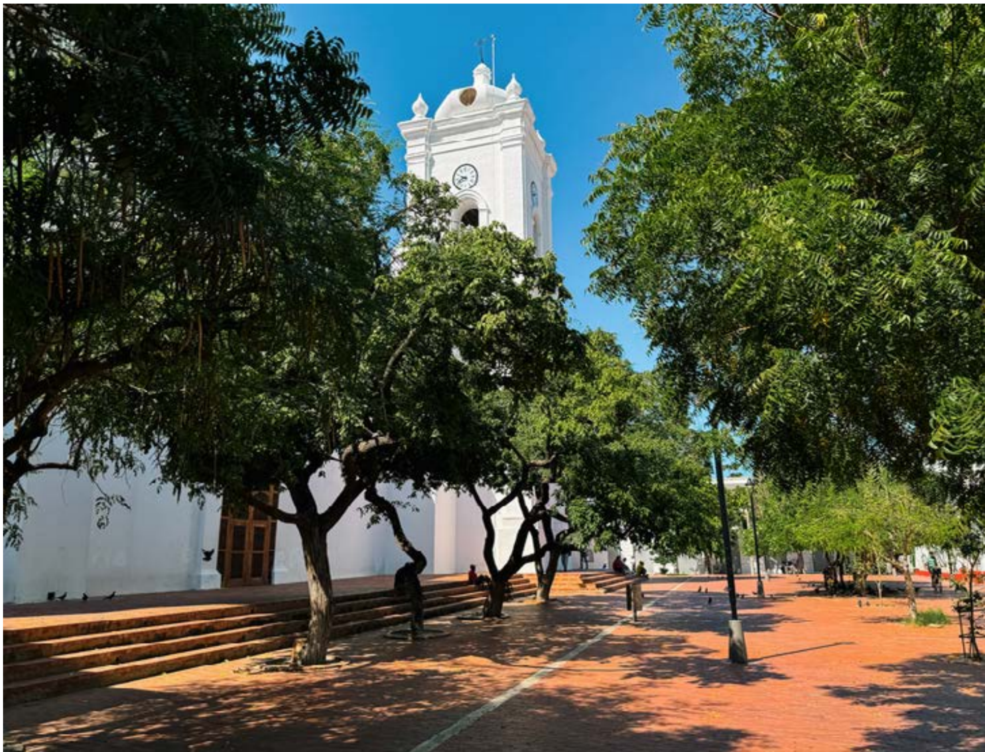
Caminar por sus calles adoquinadas es viajar en el tiempo entre fachadas restauradas que narran historias de piratas, libertadores y una arquitectura que se niega a envejecer.