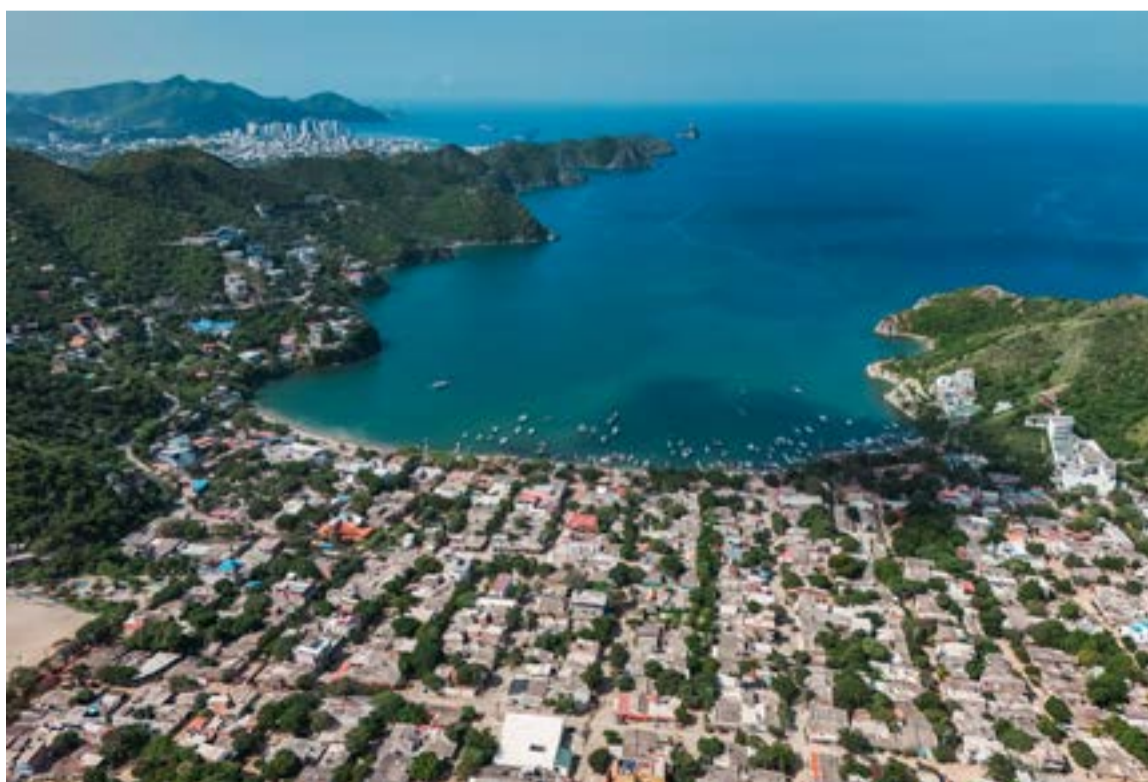
La magia de Taganga trasciende fronteras, consolidándose como un rincón imprescindible que abraza con la misma calidez a propios y extranjeros.