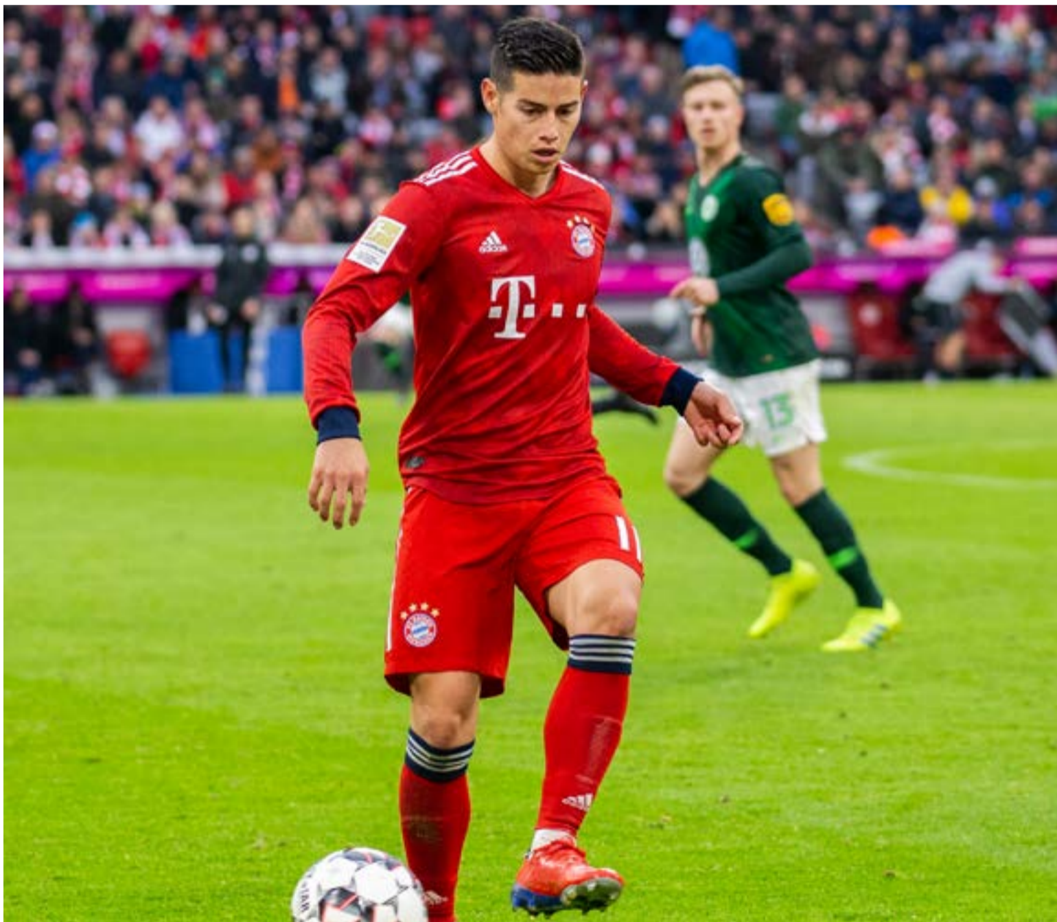
James Rodríguez jugando con el Bayer Múnich

La docuserie cuenta con intervenciones de figuras de talla mundial que compartieron vestuario con el colombiano, ofreciendo una perspectiva técnica y humana sobre lo que significa llevar el «10» en la espalda.