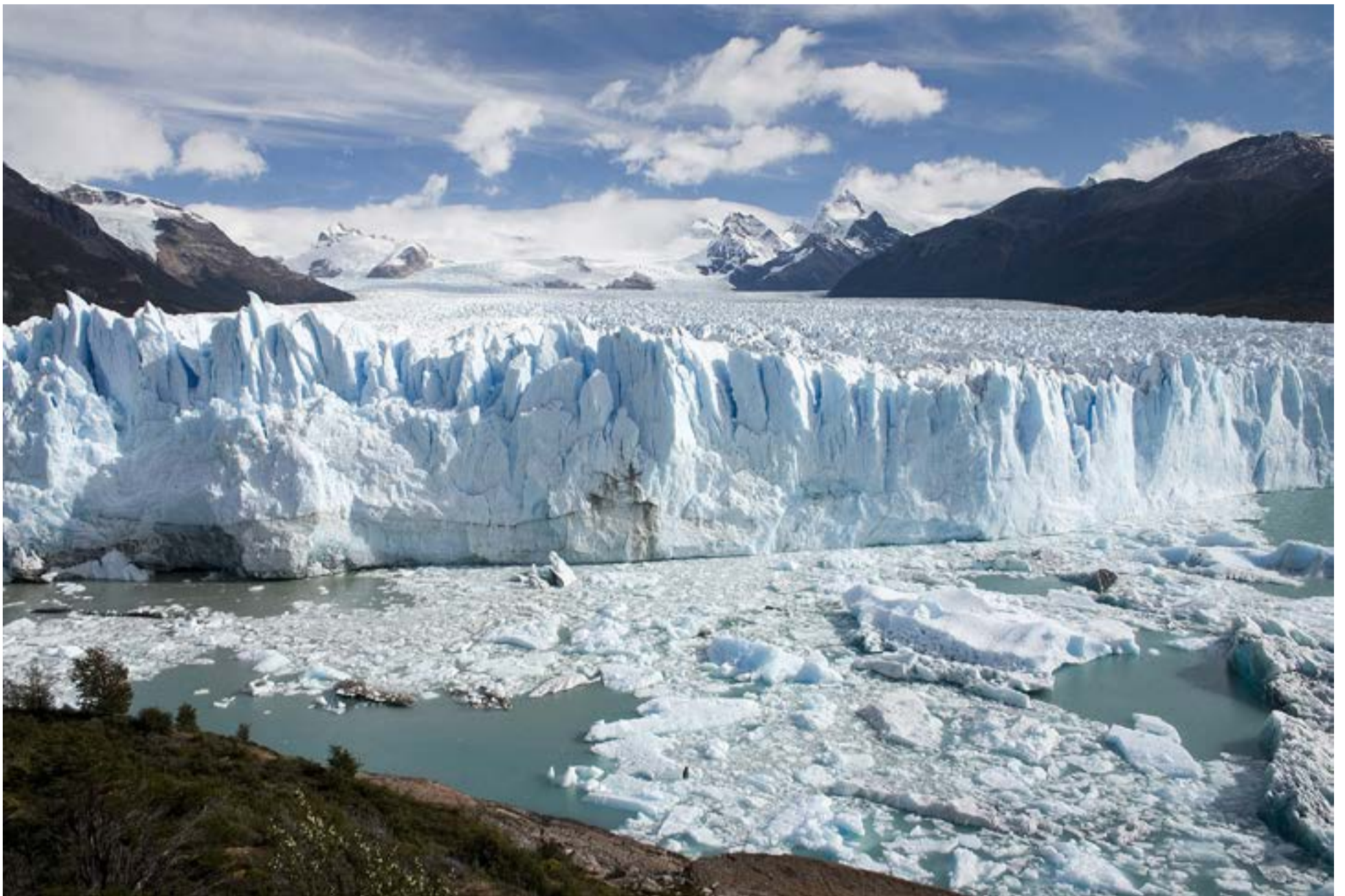
El glaciar Perito Moreno declarado Patrimonio de la Humanidad por la UNESCO