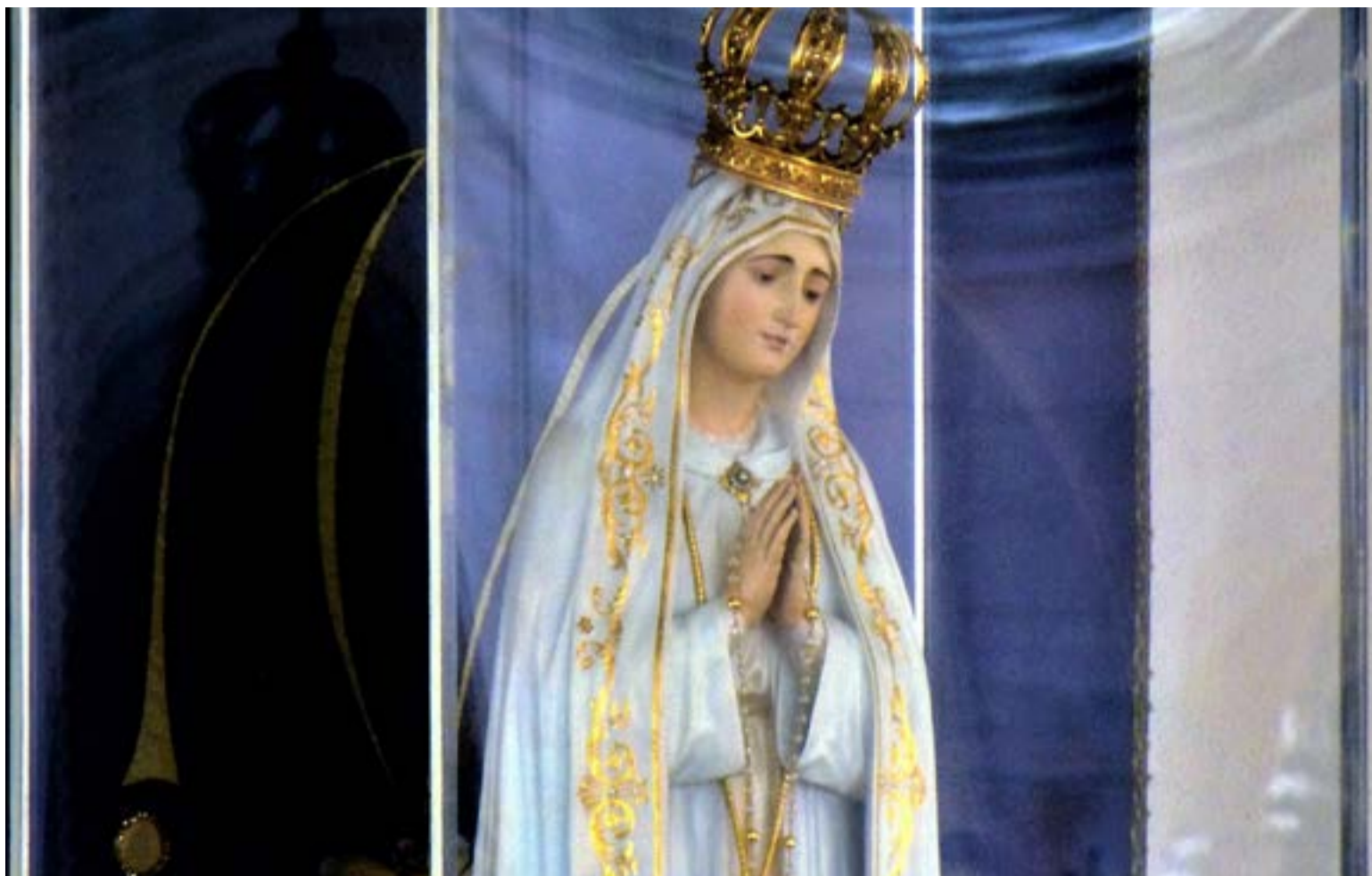
La Virgen de Fatima

Hoy ,13 de mayo, pienso en tantos devotos de Fátima y en los tantos otros que creen que será en un día como hoy que el mundo estallará.