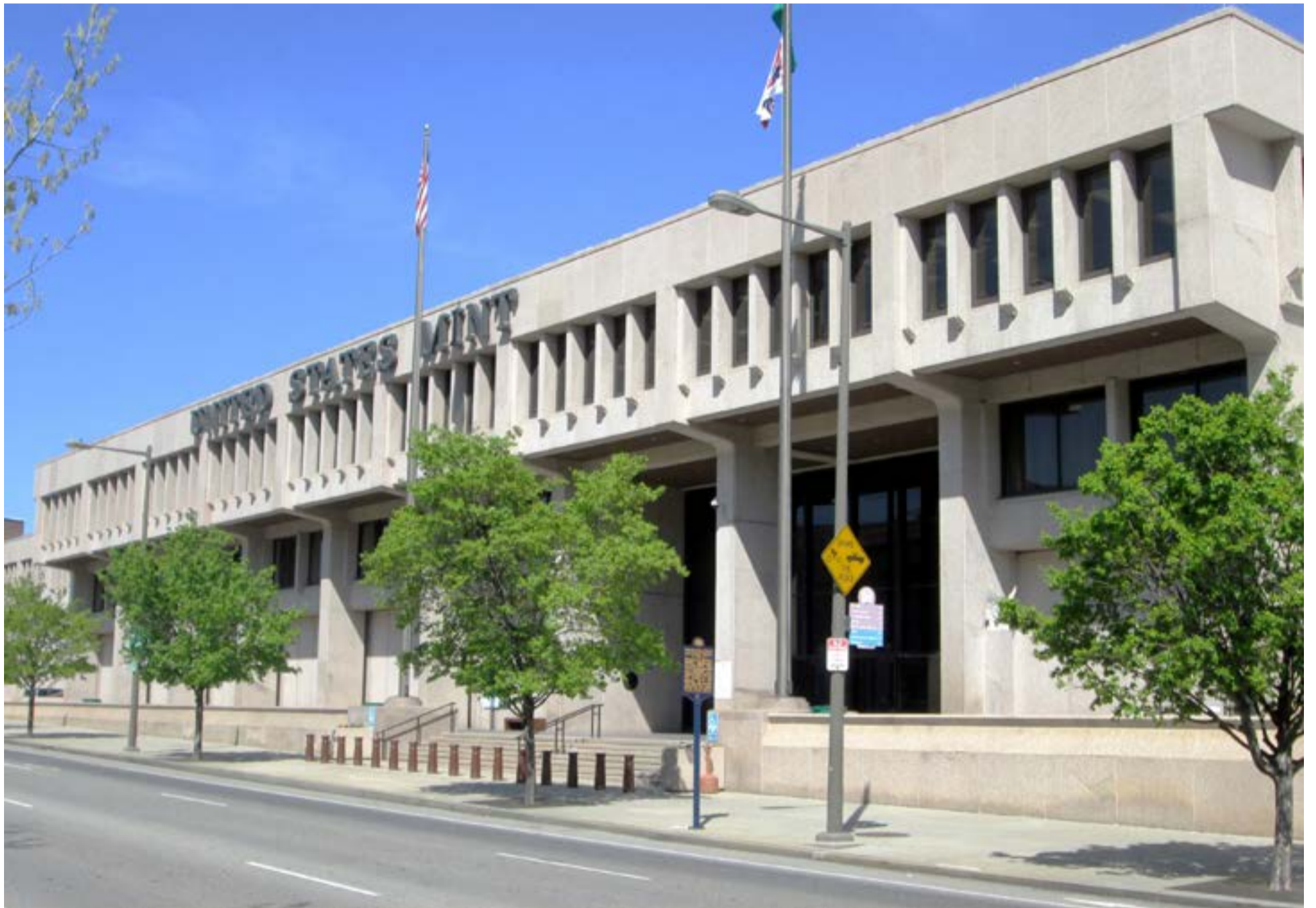
La Casa de la Moneda en Estados Unidos donde ha llegado el oro ilegal del Clan del Golfo