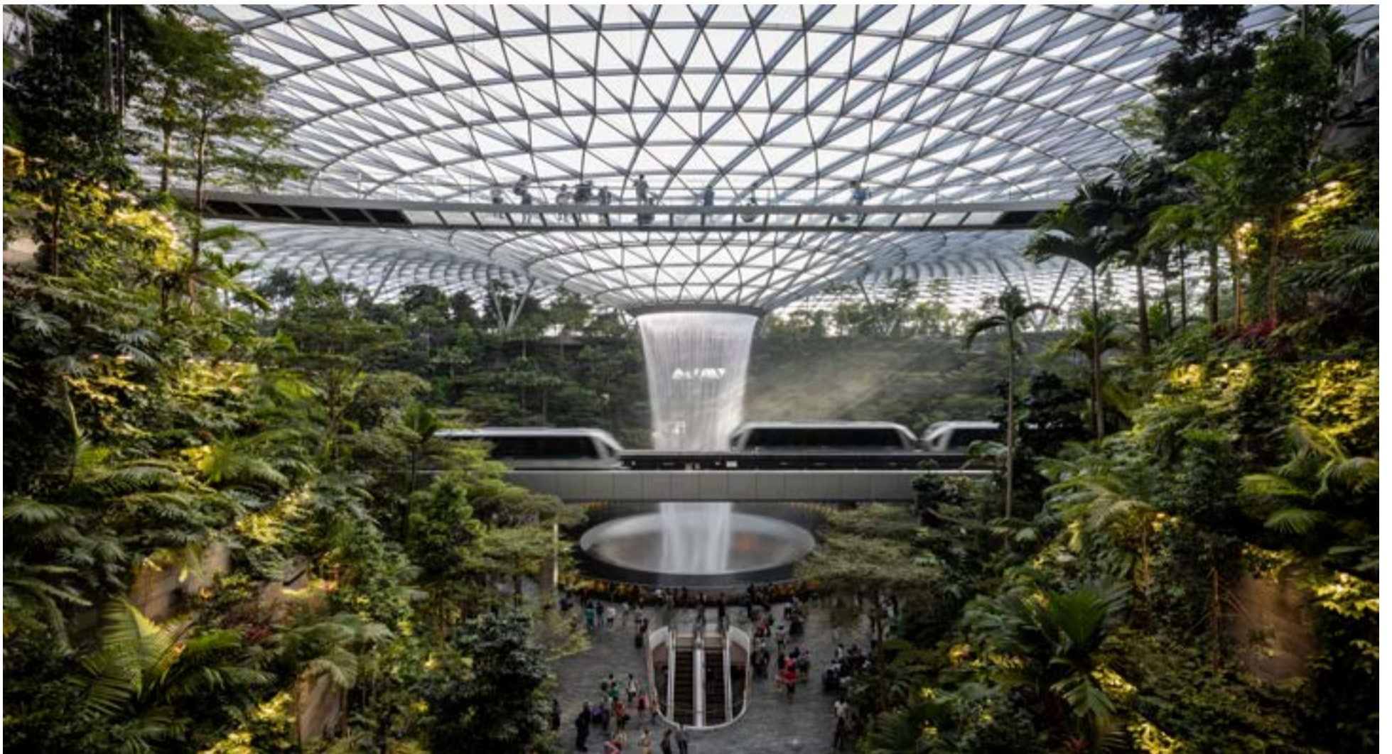
La cascada interior más grande del mundo es el Rain Vortex en el Aeropuerto Jewel Changi de Singapur, una espectacular caída de agua de 40 metros de altura que se convierte en el corazón escénico de este complejo.